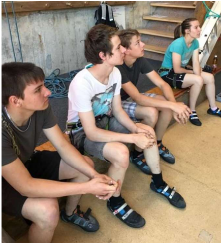
...gespannte (oder sind es skeptische?) Blicke in die Wand...

Im Anschluss an die Kletterei dislozierten wir mit zum Teil etwas schlaffen Armen auf den Schallenberg zum gemeinsamen Mittagessen, bei dem angeregte Gespräche geführt und auch die Bürgerbriefe überreicht wurden.