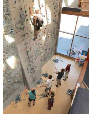
Der sportliche Ehrgeiz ist geweckt!