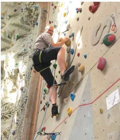
Auch ältere Herren hat das Kletterfieber gepackt!