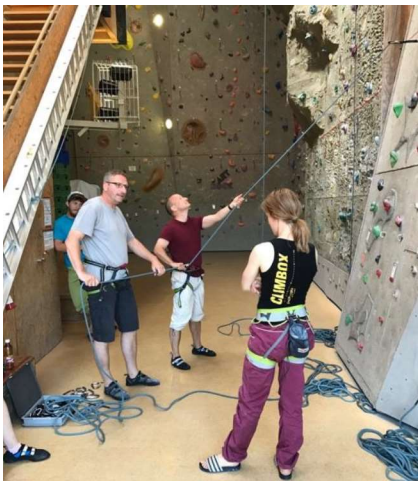
...die präsidiale Sicherung unter den wachsamen Augen der Instruktoressen