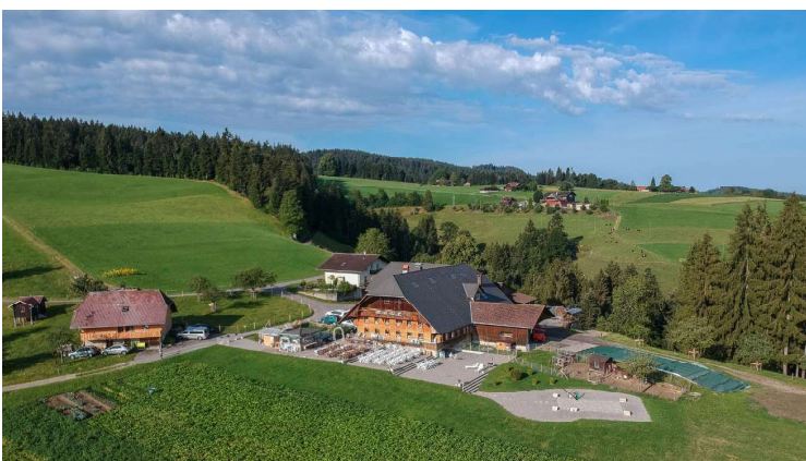
Bauernhaus Grub wielandleben